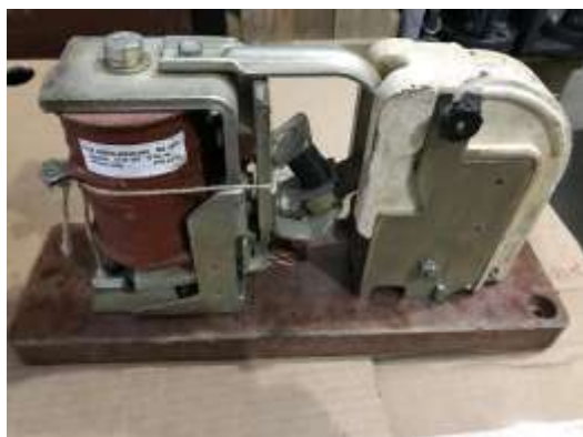
2-rasm. ТКПД-45-10 qo'zg'atishni susaytirish kontaktori

(TKПД-45-10 kontaktorlari ularga o'rnatilmagan).